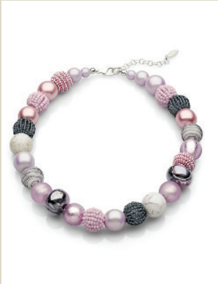
Kette Rosé Nr. 48-2254 € 89,90

Diese Jacke hat die Optik und den weichen Griff von Nubukleder, besteht aber aus pflegeleichtem Nubuskin. Es ist federleicht; die ganze Jacke wiegt nur ca. 390 Gramm. Feminin wirkt der Schnitt mit Stehkragen und feinen, perforierten Einsätzen.