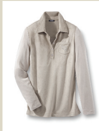
Polo Softskin Gr.: 36-54 Nr. 43-2821 ab € 69,90

Gegensätze ziehen sich an: seidiger Feinstrick und die Passe im größeren Patentstrick mit Glamourfaktor. Perfekt harmonisiert die Materialkombination mit Cashmere und Seide. Die liegt schmeichelnd weich auf der Haut und klimatisiert.