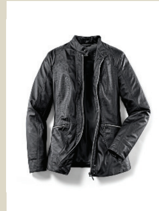
Nappskin Jacke Bestform Gr.: K 18-24/ N 36-50 Nr. 44-1103 ab € 149,-