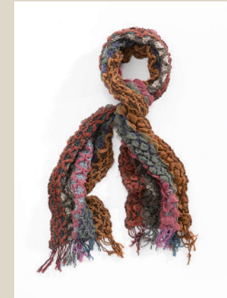
Schal Cloqué Nr. 48-2310 € 29,90