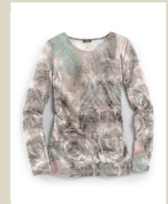
Shirt Soft Rose Gr.: 36-54 Nr. 43-1749 ab € 39,90