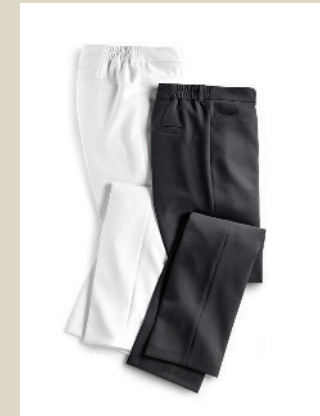
Kofferhose Gr.: K 19-24/ N 38-52 Nr. 44-3605 ab € 89,90