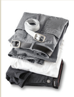
T400 Powerstretch Jeans Gr.: K 18-24/ N 36-50 Nr. 44-3665 ab € 89,90