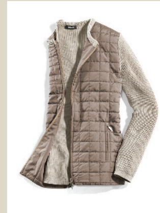
Steppstrickjacke Gr.: 36-54 Nr. 43-2992 ab € 99,90

Designer wagen sich in dieser Saison besonders gerne an neue Mixturen. Die Kombination aus Stepp und Strick wirkt stimmig und trägt sich dabei leicht und angenehm. Optisch überzeugt die Jacke durch einen sportlichen Auftritt.