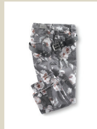
Hose Rosendessin Gr.: K 18-24/ N 36-50 Nr. 44-3699 ab € 99,90

Leichter als manches T-Shirt ist der Pullover aus reinem Cashmere, nicht umsonst eine der wertvollsten Naturfasern der Welt. Mit herzförmigem Ausschnitt und femininen Rippenstrick- bündchen an Ärmeln und Hüften.