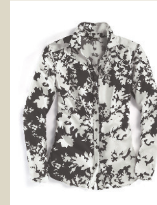
Bluse Schattenspiel Gr.: 36-52 Nr. 55-2330 ab € 79,90

Nur Licht und Schatten: Die aus Asien stammende Kunstform wird durch neue Techniken aktualisiert. Hier geben schwarze und weiße Schatten der Bluse Lebendigkeit. Der feine Stoff fällt sehr schön, der offene Kragen lässt Schmuck wirken.