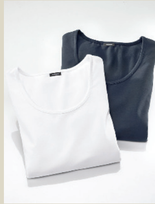
Viskose Top Gr.: 36-54 Nr. 43-1900 ab € 19,90

Ponchos liegen voll im Trend - diese Variante wird wie eine Strickjacke leicht an- und ausgezogen und wirkt trotzdem wie ein lässiger Poncho. Das raffinierte Rauten-Jacquardmuster ist von beiden Seiten zu tragen, eine Seite dunkler, die andere heller.