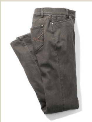
Yoga Jeans Supersoft Gr.: K 18-23/ N 38-48/ L 72-88 Nr. 44-3658 ab € 89,90

Aus Italien stammt das effektvolle Bouclégarn mit Alpaka für diesen Mantel. Naturfarben und ein dezentes Fischgratmuster geben ihm die besondere Note. Neu ist der Schnitt mit leichter A-Linie, sie umschmeichelt die Silhouette.