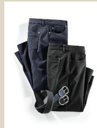
5 Pocket Gr.: K 18-24/ N 36-50 Nr. 44-3754 ab € 89,90