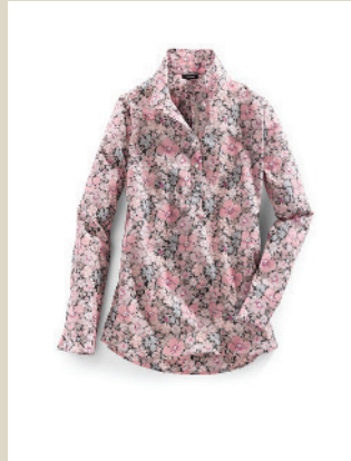
Shirtbluse Blütenmeer Gr.: 36-52 Nr. 55-2317 ab € 99,90