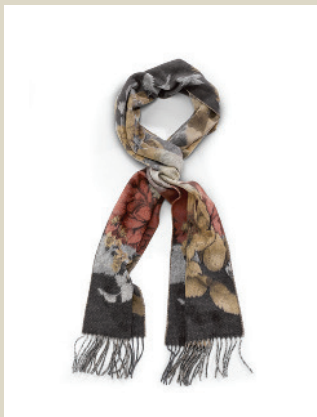
Schal Herbstlaune Nr. 48-2316 € 99,90