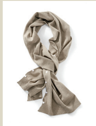
7-Wunder Schal Nr. 49-1953 € 69,90