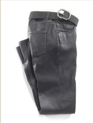
Lederoptik Hose Gr.: K 18-24/ N 36-50 Nr. 44-3994 ab € 99,90