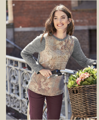
Pullover Herbstlaune Gr.: 36-54 Nr. 43-1381 ab € 69,90