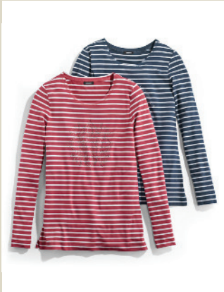
Ringelshirt Cambridge Gr.: 36-54 Nr. 43-2507 ab € 39,90

Hier schwingt britisches Understatement mit. Optisch chic durch die Stoppungen, den dezenten Glanz und den vielseitigen Marineton. Angenehm wärmend wirkt der Sandwich-Stepp, trotzdem ist die Jacke herrlich leicht.