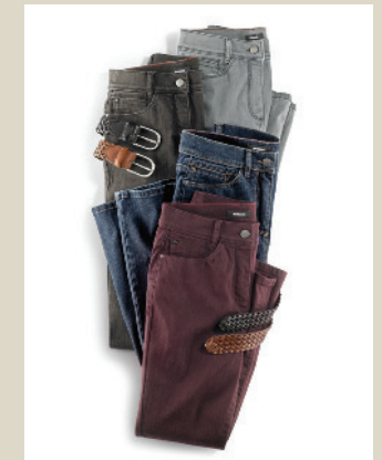
Yoga Jeans Supersoft Gr.: K 18-24/ N 36-50/ L 72-88 Nr. 44-3655 ab € 89,90

Wenn es nach uns geht, dürfen die Lämmer im Herbst ihr Fell selbst behalten. Denn dann kommt diese Weste in Lammfelloptik zum Einsatz: kuschelig weich und dazu federleicht. Ein modisches Muss für den kommenden Winter.