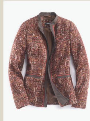
Bouclé Jacke Toscana Gr.: K 18-24/ N 36-50 Nr. 44-2245 ab € 179,-