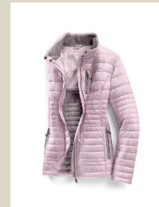
Leichtstepper Zauberwatte Gr.: 36-52 Nr. 44-3327 ab € 129,-