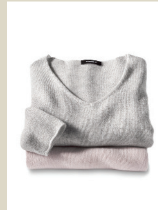
Cashmere Leicht-Pullover Gr.: 36-50 Nr. 43-2248 ab € 139,-

Leichter als manches T-Shirt ist der Pullover aus reinem Cashmere, nicht umsonst eine der wertvollsten Naturfasern der Welt. Mit herzförmigem Ausschnitt und femininen Rippenstrick- bündchen an Ärmeln und Hüften.