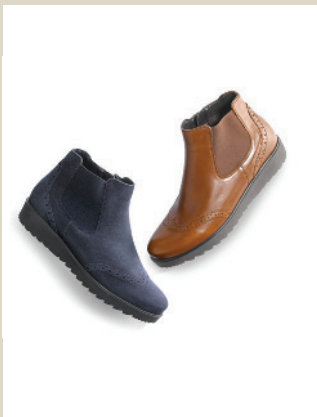
Federleicht Chelsea Gr.: 39-42 Nr. 45-1019 € 99,90