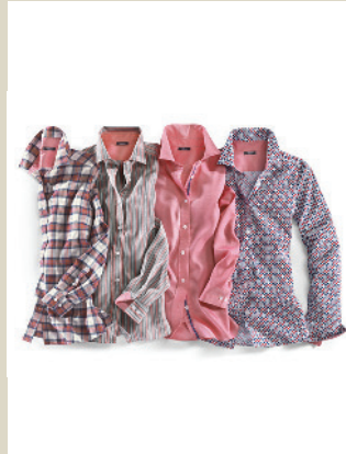
Extraglattbluse Oxford Gr.: 36-52 Nr. 55-2322 ab € 59,90