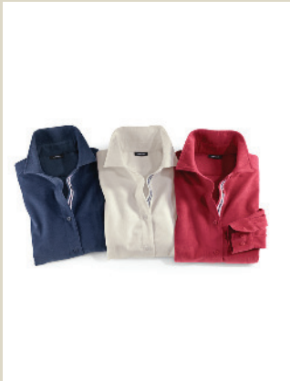
Babycordbluse Gr.: 36-52 Nr. 55-2340 ab € 69,90