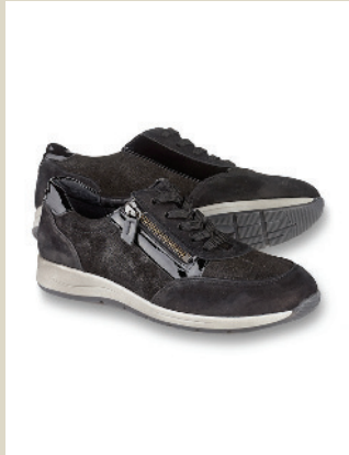
Glitzer Sneaker Gr.: 36-42 Nr. 45-0408 € 89,90