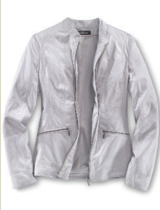
Nubuskinjackete Federleicht Gr.: K 18-24 / N 36-52 Nr. 44-2114 ab € 149,-