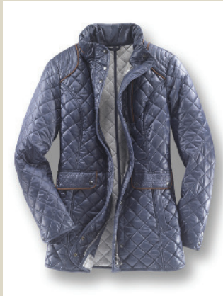
Leichtstepper Cambridge Gr.: K 18-23/ N 36-50 Nr. 44-3334 ab € 179,-

Hier schwingt britisches Understatement mit. Optisch chic durch die Stoppungen, den dezenten Glanz und den vielseitigen Marineton. Angenehm wärmend wirkt der Sandwich-Stepp, trotzdem ist die Jacke herrlich leicht.