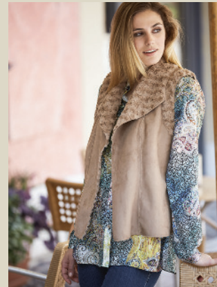
Weste Felloptik Gr.: 36-50 Nr. 44-0006 ab € 79,90

Wenn es nach uns geht, dürfen die Lämmer im Herbst ihr Fell selbst behalten. Denn dann kommt diese Weste in Lammfelloptik zum Einsatz: kuschelig weich und dazu federleicht. Ein modisches Muss für den kommenden Winter.