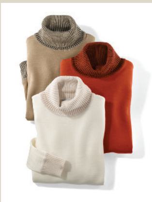
Rollkragenpullover Gr.: 36-50 Nr. 43-2634 ab € 84,90