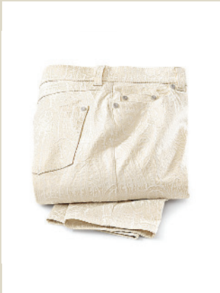
Jacquard Hose Glamour Gr.: K 18-24/ N 36-50 Nr. 44-3842 ab € 99,90