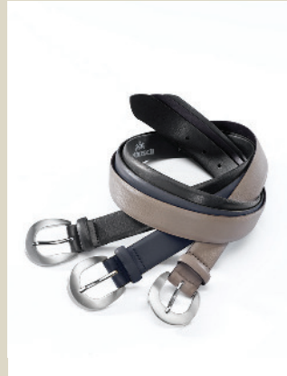
Ledergürtel Gr.: 80-115 Nr. 49-0950 € 29,90