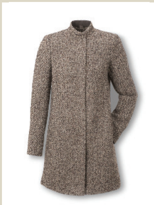
Wollmantel Milano Gr.: K 18-23/ N 38-48 Nr. 44-3358 ab € 299,-