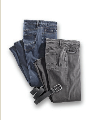
Lieblingsjeans Gr.: K 18-24/ N 36-50 Nr. 44-3668 ab € 89,90