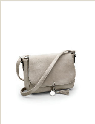
Crossover Tasche Nr. 49-1677 € 69,90