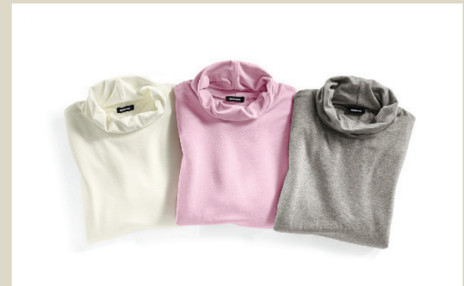
Viskose Unterziehrollis 2 für 1 Gr.: 36-54 Nr. 43-2330 ab € 69,90