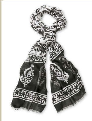
Schal Schattenspiel Nr. 48-0541 € 29,90

Einfach magisch lässt die Shirtbluse ein paar Kilos verschwinden. Das liegt an dem modischen Blouson-schnitt: Die legere Form mit dem Gummizug im Saum sitzt perfekt auf der Hüfte. Kleine Falten am Ausschnitt geben mehr Weite und unterstreichen den schönen, fließenden Fall des Stoffs. Immer aktuell: Black & White.