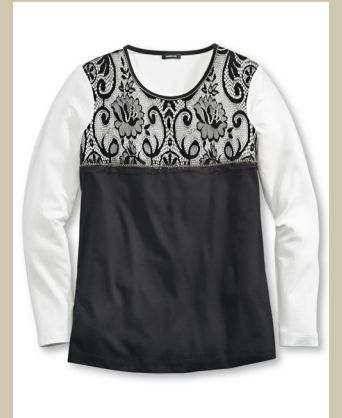
Galashirt Samt und Seide Gr.: 36-54 Nr. 43-2509 ab € 69,90

Schwarz tragen kann jede, aber ein weißer Blazer ist ein modisches Statement. Dieser Kofferblazer überzeugt nicht nur durch seine zeitlose Eleganz. Er ist waschmaschinenfest, knitterfrei und ideal auf Reisen. Stoff und Futter sind elastisch, das macht den Blazer so bequem.