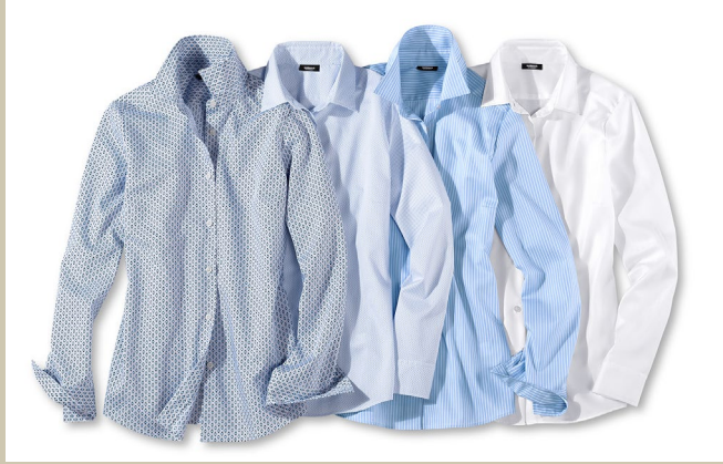
Extraglatt Bluse Zeitlos Gr.: 36-52 Nr. 55-2307 ab € 59,90