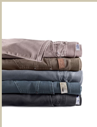
Raphaela by Brax Jeans Gr.: K 18-25 / N 38-50 Nr. 44-3525 ab € 109,-

Bezaubert auf den ersten Blick und beim ersten Tragen: die Tunika im dekorativen Blüten- und Ornamentmuster. Die Materialmischung aus leichter Baumwolle und feinsten Seide gibt ihr den fließenden Fall und den zarten Glanz. Modisch aktuell ist jetzt der kleine Stehkragen mit Bändern.