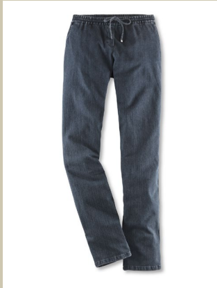
Wellness Jeans Gr.: K 18-24/ N 36-50 Nr. 44-3585 ab € 99,90