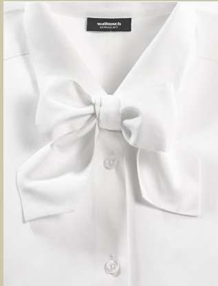
Schluppenbluse Extraglatt Gr.: 36-52 Nr. 55-1318 ab € 79,90

Von „La Torre“, einer Weberei in der Nähe von Prato in der Toskana, kommt der feine Bouclé für diesen Blazer. Die vielen Farbtöne – von Blau über Weiß bis Haselnuss – geben dem effektvollen Bouclégarn die Raffinesse. So lässt sich der Blazer vielseitig kombinieren, chic zur braunen Hose oder sportlich mit Jeans.