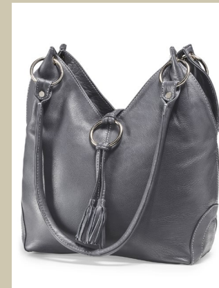
Ledertasche Samarkand Nr. 49-0008 € 129,00