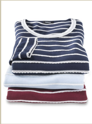
Shirt Strukturstreifen Gr.: 36-54 Nr. 43-2663 ab € 49,90

Erste Wahl bei frischen Brisen: Dieser Leichtstepper behauptet sich spielend, wenn der Wind auffrischt. Der farblich abgesetzte Westeneinsatz sieht gut aus und er schützt zusätzlich – zusammen mit der modisch angeschnittenen Kapuze. Überraschend: Die Steppja- cke bringt nur leichte 550 Gramm auf die Waage.