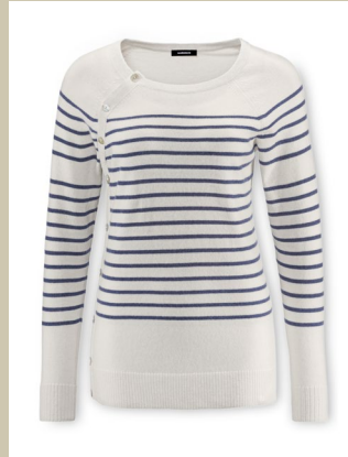
Ringpulli Leinen Los Gr.: 36-48 Nr. 43-1398 ab € 129,00