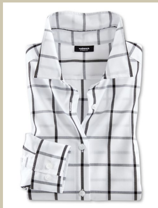
Extraglatt Bluse Black & White Gr.: 36-52 Nr. 55-2239 € 59,90