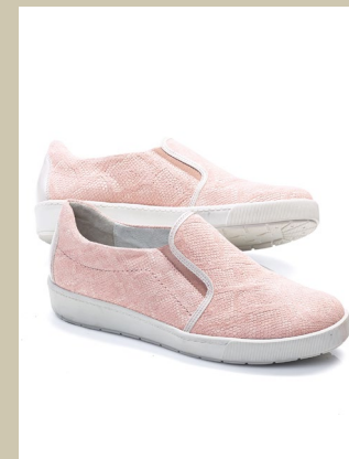
Waldläufer Bequem-Slipper Gr.: 36-42 Nr. 45-0762 ab € 89,90