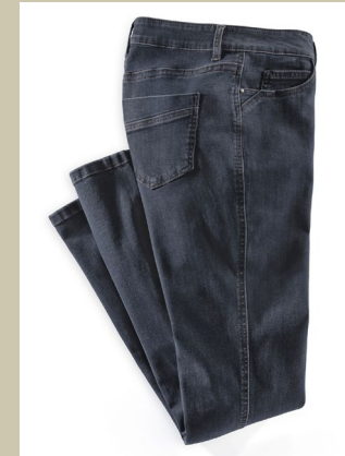
Jeans Bestform Gr.: K 18-24/ N 36-50 Nr. 44-3572 ab € 99,90

Doppelt schön: die Wendeweste Argyle. Je nach Outfit und Laune passt die Seite in Uni-Marine oder im schönen Rautenmuster. Bei den diagonalen Steppungen wurde extra auf eine figurfreundliche Silhouette geachtet. Flexibel, leicht und knitterfrei ist diese Weste ein praktisches Basic für mehr als eine Saison.