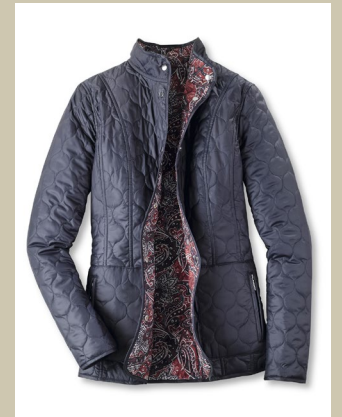
Wendejacke Paisleystepp Gr.: K 18-23/ N 36-50 Nr. 44-3374 ab € 149,-

Inspiriert von den Farben der Seidenstrasse: Blätter und Blüten in dekorativem Paisleymuster zieren dieses Shirt. Die Briten entdeckten die floralen Motive in Indien und nahmen sie mit nach Großbritannien. Nach der schottischen Stadt Paisley benannt, wurden sie zum Modetrend – und sind in dieser Saison wieder angesagt.