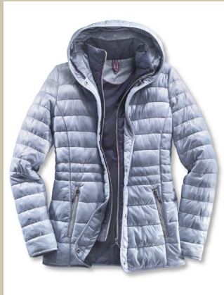
Leichtstepper Frische Brise Gr.: K 18-23 / N 36-48 Nr. 44-3395 ab € 149,00