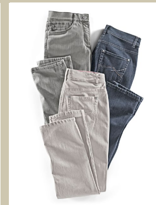
Yoga Jeans Supersoft Gr.: K 18-24/N 36-50/L 80-96 Nr. 44-3659 ab € 89,90