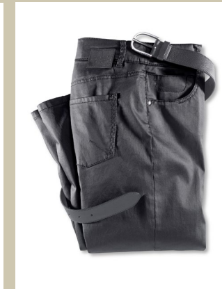
Lederoptik Hose Gr.: K 18-24 / N 36-50 Nr. 44-3994 ab € 99,90