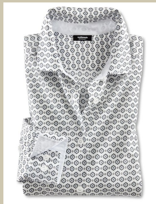
Extraglatt Bluse Black & White Gr.: 36-52 Nr. 55-2236 € 59,90

Bequem, lässig, kombinati- onsstark: die Blusen im zeitlos-modischen Black & White-Look. Kragen und Manschetten spielen mit kleinen Akzenten. Feine Baumwolle sorgt für hohen Tragekomfort, die Extra- glatt-Veredelung macht die Blusen bügelfrei. So praktisch ist die Bluse eine echte Alternative zum Shirt.