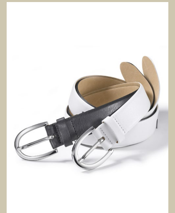
Ledergürtel Klassik Gr.: 80-115 cm Nr. 49-0950 € 29,90