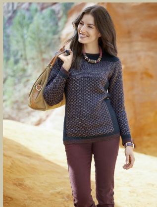
Pullover Seidenstrasse Gr.: 36-54 Nr. 43-2433 ab € 119,00