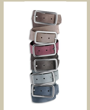
Ledergürtel Gr.: 80-115 cm Nr. 49-0135 € 24,90