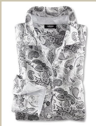
Extraglatt Bluse Black & White Gr.: 36-52 Nr. 55-2235 € 59,90

Bequem, lässig, kombinati- onsstark: die Blusen im zeitlos-modischen Black & White-Look. Kragen und Manschetten spielen mit kleinen Akzenten. Feine Baumwolle sorgt für hohen Tragekomfort, die Extra- glatt-Veredelung macht die Blusen bügelfrei. So praktisch ist die Bluse eine echte Alternative zum Shirt.