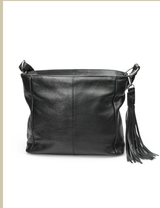
Ledertasche Noir Nr. 49-0025 € 119,-