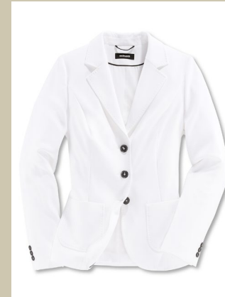
Kofferblazer White&Black Gr.: K 18-24 / N 36-52 Nr. 44-3008 ab € 149,-

Schwarz tragen kann jede, aber ein weißer Blazer ist ein modisches Statement. Dieser Kofferblazer überzeugt nicht nur durch seine zeitlose Eleganz. Er ist waschmaschinenfest, knitterfrei und ideal auf Reisen. Stoff und Futter sind elastisch, das macht den Blazer so bequem.