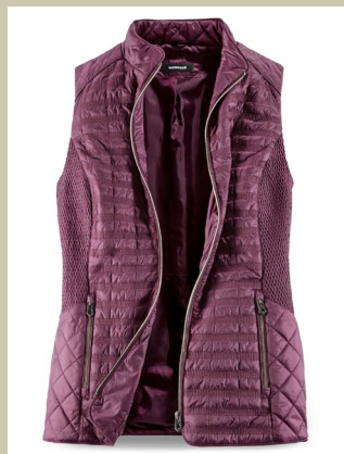
Steppweste Harmonika Gr.: 36-50 Nr. 44-0142 ab € 79,90