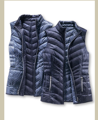
Wendeweste Argyle Gr.: 36-50 Nr. 44-0139 ab € 89,90