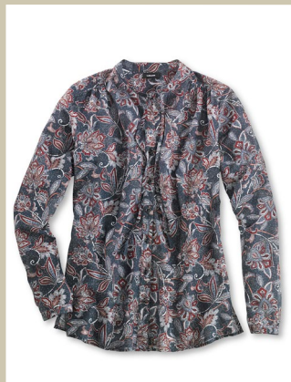
Tunika Seidenstrasse Gr.: 36-52 Nr. 55-1303 ab € 89,90