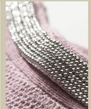
Pulli Glitzerband Gr.: 36-54 Nr. 43-2274 ab € 79,90