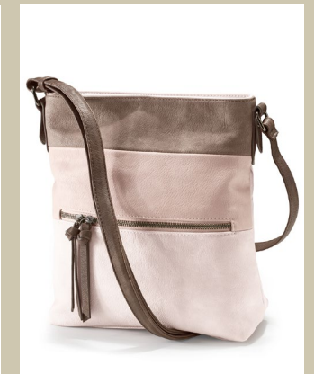
Tasche Farbenspiel Nr. 49-0014 € 59,90