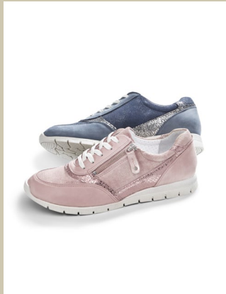
Reißverschluss Sneaker Gr.: 36-42 Nr. 45-0475 € 89,90

Erste Wahl bei frischen Brisen: Dieser Leichtstepper behauptet sich spielend, wenn der Wind auffrischt. Der farblich abgesetzte Westeneinsatz sieht gut aus und er schützt zusätzlich – zusammen mit der modisch angeschnittenen Kapuze. Überraschend: Die Steppja- cke bringt nur leichte 550 Gramm auf die Waage.