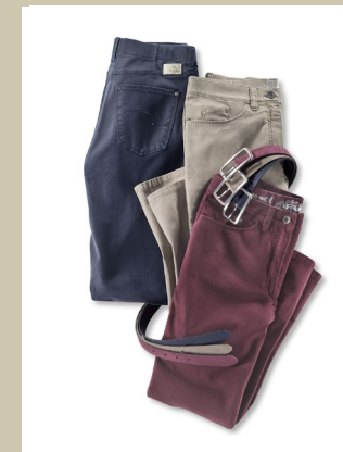
Raphaella by Brax Jeans Gr.: K 18-25 / N 38-50 Nr. 44-3525 ab € 109,-