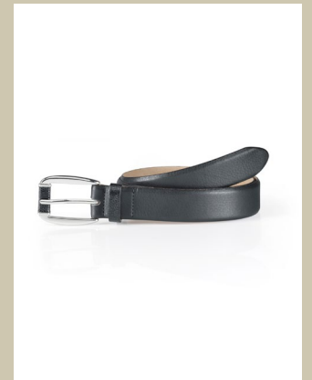
Ledergürtel Schmuckschließe Gr.: 80-105 cm Nr. 49-0113 € 39,90