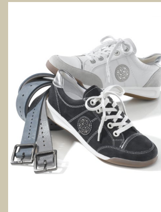
Sneaker Sommerleicht Gr.: 37-42 Nr. 45-1029 € 99,90