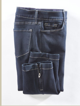
NYDJ Jeans Ankle Zipp Gr: 34-48 Nr. 44-3843 € 139,00