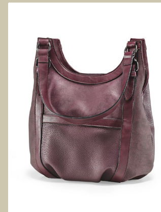
Handtasche Ordnungsrausch Nr. 49-0017 € 79,90