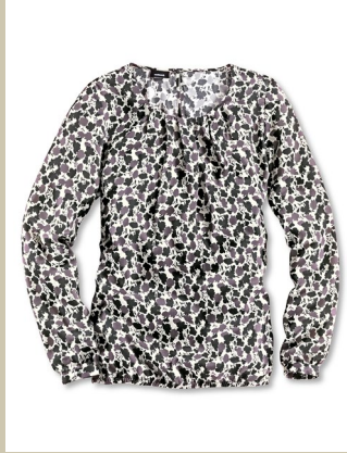
Shirtbluse Magic Gr.: 36-52 Nr. 55-1385 ab € 89,90