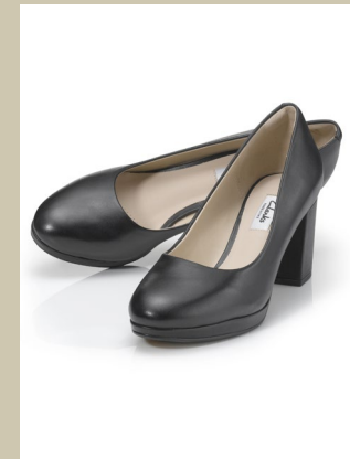
Clarks Pumps Gr.: 3,5-8 Nr. 45-0885 € 109,-