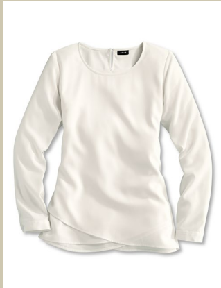
Layering Shirtbluse Gr.: 36-52 Nr. 55-1390 ab € 49,90