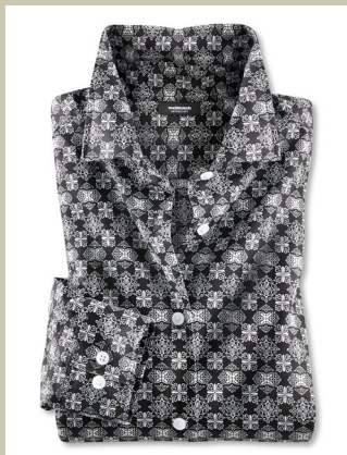
Extraglatt Bluse Black & White Gr.: 36-52 Nr. 55-2238 € 59,90