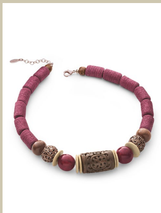
Kette Samarkand Nr. 48-0237 € 79,90

Bezaubert auf den ersten Blick und beim ersten Tragen: die Tunika im dekorativen Blüten- und Ornamentmuster. Die Materialmischung aus leichter Baumwolle und feinsten Seide gibt ihr den fließenden Fall und den zarten Glanz. Modisch aktuell ist jetzt der kleine Stehkragen mit Bändern.