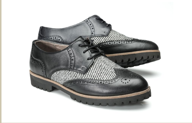
Leder-Derby Schwarz/Weiß Gr.: 36-42 Nr. 45-0448 € 89,90