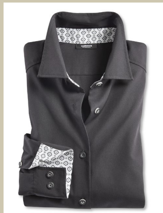
Extraglatt Bluse Black & White Gr.: 36-52 Nr. 55-2234 € 59,90