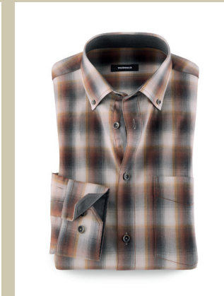
Herringbone-Hemd Shadow Kw.: 38-46 Nr. 15-5242 ab € 49,90

Die Lederjacke hat im Leben eines Mannes einen besonderen Stellenwert und verleiht dem Träger immer auch einen leicht rebellischen Touch. Doch diese Jacke hat auch eine weiche Seite: Durch eine spezielle Behandlung wird das Lammleder besonders geschmeidig. Damit alles perfekt sitzt, ist die Biker-Jacke auch in unteretzten Größen erhältlich.