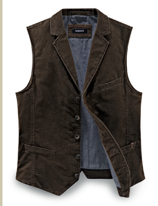
Sportsamt Weste Gr.: U 24-29/N 48-58 Nr. 24-3647 ab € 119,-