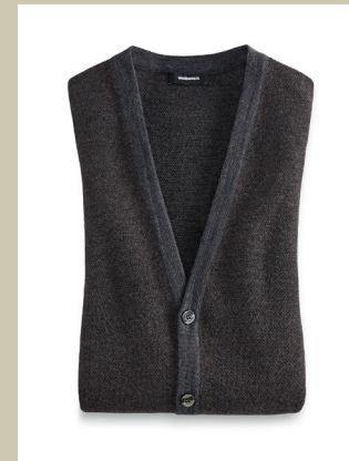
Merino-Westе Punto Riso Gr.: 48-58 Nr. 23-3920 ab € 89,90