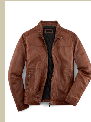
Nappaleder Biker Gr.: U 24-28 / N 48-58 Nr. 24-6307 ab € 349,-