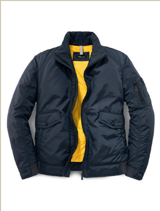
Limonta Blouson Gr.: U 24-28 / N 48-58 Nr. 24-3619 ab € 249,-