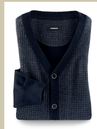
Jacquard-Cardigan Pepita Gr.: 48-58 Nr. 23-3013 ab € 119,-

Ein Cardigan mit kunstvollem Charakter! Das dezente Pepita-Muster aus kleinen Karos mit diagonaler Verbindung sorgt für einen ausgefallenen zweifarbigen Kontrast. Das aufwendig in Jacquard-Technik gestrickte Muster zeigt sich kombinationsstark. Ob im Freizeit-Look oder für ein formelles Outfit – die Strickkunst passt sich gekonnt an.