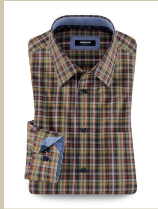
Extraglatt-Hemd Herbst-Trio Kw.: 38-52 Nr. 15-3875 ab € 59,90

Morgens kühl, mittags warm – wenn das Wetter noch unentschlossen ist, spielt die leichte Steppweste ihre Stärken aus. Mit ihrer daunenähnlichen Wattierung wärmt sie den Oberkörper und ersetzt auch mal die Jacke – bei gerade mal ca. 270 Gramm Gewicht. Tipp: Das Kastanienrot passt perfekt zu herbstlichen Karo-Hemden. Auch in Marine erhältlich.