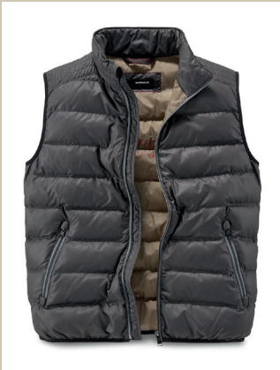
Struktursteppweste Gr.: 48-60 Nr. 24-3645 ab € 119,-