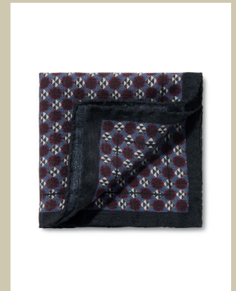
Einstecktuch Geometrie-Mix Nr. 28-0843 € 29,90