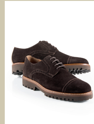
Derby Superleicht Gr. 39-46 Nr. 25-1061 € 119,-