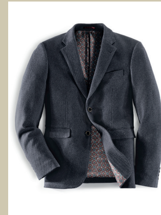
Highflex-Sakko Gr.: U 24-29 / N 48-58 Nr. 24-1568 ab € 169,-

Bequem oder einwandfreier Sitz? Dieses Sakko aus bi-elastischem Struktur-Jersey schafft beides. Spielend leicht macht es jede Bewegung mit, ohne einzuengen. Durch die hochwertige Qualität des Jerseys verfügt es aber auch über genügend Standkraft, um selbst nach einem langen Tag noch gut in Form zu sein. Lieferbar in 12 Größen für eine perfekte Passform.