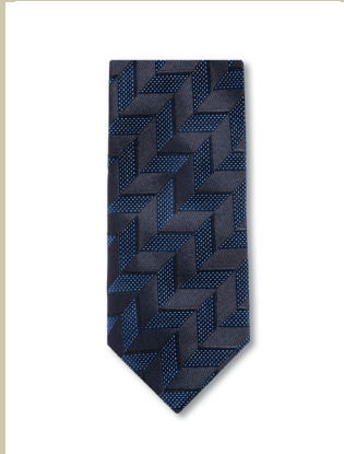
Seidenkrawatte Mini-Hahnentritt Nr. 28-1704 € 29,90