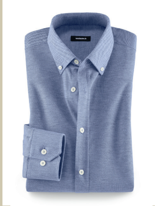
Piqué-Hemd T-Shirt-Komfort Kw.: 38-46 Nr. 15-5079 ab € 69,90

Modisch rückt die Weste immer mehr in den Fokus. Und längst versteckt sie sich nicht mehr nur unter dem Sakko. Möglich macht das der stoffgleiche Rücken. So können Sie diese Weste auch mal solo tragen. Raffiniertes Detail: der Brusttaschenbeutel, der sich als Einstecktuch herausziehen lässt.