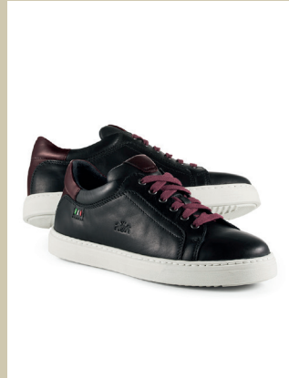
Rindleder Allrounder Gr.: 39-46 Nr. 25-1260 € 99,90