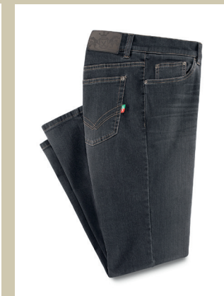
Sprinter Jeans Gr.: U 24-29 / N 48-58 Nr. 24-3872 ab € 99,90