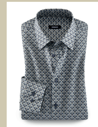
Liberty-Hemd Pantages Kw.: 38-44 Nr. 15-3947 € 79,90

Ein Cardigan mit kunstvollem Charakter! Das dezente Pepita-Muster aus kleinen Karos mit diagonaler Verbindung sorgt für einen ausgefallenen zweifarbigen Kontrast. Das aufwendig in Jacquard-Technik gestrickte Muster zeigt sich kombinationsstark. Ob im Freizeit-Look oder für ein formelles Outfit – die Strickkunst passt sich gekonnt an.