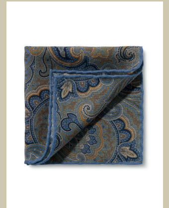
Einstecktuch Paisleydruck Nr. 28-0849 € 29,90

Bequem oder einwandfreier Sitz? Dieses Sakko aus bi-elastischem Struktur-Jersey schafft beides. Spielend leicht macht es jede Bewegung mit, ohne einzuengen. Durch die hochwertige Qualität des Jerseys verfügt es aber auch über genügend Standkraft, um selbst nach einem langen Tag noch gut in Form zu sein. Lieferbar in 12 Größen für eine perfekte Passform.