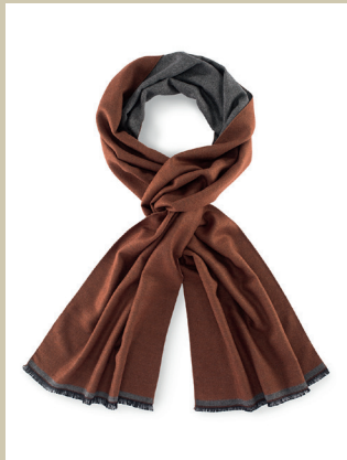
Wollschal Doubleface Nr. 29-1252 € 39,90