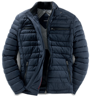
High Flex Thermo Jacke Gr.: U 24-28 / N 48-58 Nr.: 24-3663 ab € 199,-