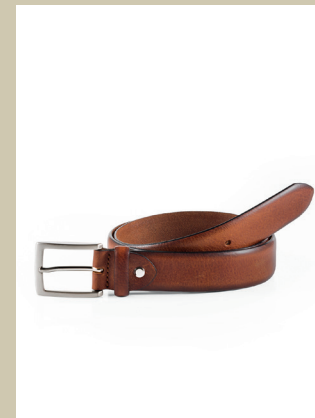
Indian Summer Gürtel Handfinish Gr.: 90-120 cm Nr. 29-0033 € 49,90

Die Lederjacke hat im Leben eines Mannes einen besonderen Stellenwert und verleiht dem Träger immer auch einen leicht rebellischen Touch. Doch diese Jacke hat auch eine weiche Seite: Durch eine spezielle Behandlung wird das Lammleder besonders geschmeidig. Damit alles perfekt sitzt, ist die Biker-Jacke auch in unteretzten Größen erhältlich.