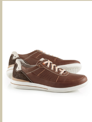
City-Sneaker Gr.: 39-46 Nr. 25-1218 € 99,90