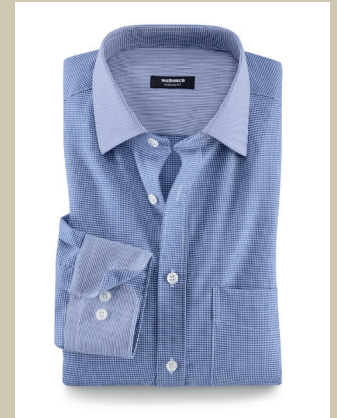
Extraglatt-Hemd Mix&Match Kw.: 38-46 Nr. 15-3925 ab € 59,90

Sein Geheimnis: Ihr Komfort! Bei diesem Sakko sorgen unsichtbar in den Schulterbereich integrierte Dehnzonen und ein Schuss Elasthan für das Plus an Bewegungsfreiheit. Dazu ist das Flexmax-Sakko ein wahres Kombinationstalent: Das harmonische, zweifarbiges Minimal-Muster ist sowohl freizeit- als auch businessstauglich.