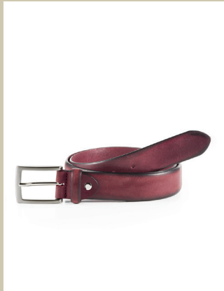
Indian Summer Gürtel Handfinish Gr.: 90-120 cm Nr. 29-0032 € 49,90

Modisch rückt die Weste immer mehr in den Fokus. Und längst versteckt sie sich nicht mehr nur unter dem Sakko. Möglich macht das der stoffgleiche Rücken. So können Sie diese Weste auch mal solo tragen. Raffiniertes Detail: der Brusttaschenbeutel, der sich als Einstecktuch herausziehen lässt.