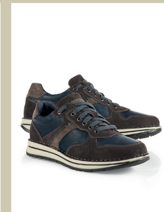
Sneaker Handnaht Gr.: 39-46 Nr. 25-1176 € 89,90