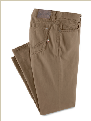
Dual FX Five Pocket Gr.: U 24-29 / N 48-58 Nr. 24-3462 ab € 89,90

Die besten Stoffe kommen aus Italien! Diesen hier haben wir bei der Traditionswweberei Limonta gefunden und zu einem modischen Blouson verarbeitet. Eine langlebige Qualität sowie eine zeitlos-moderne Optik sind typische Merkmale von Limonta-Stoffen. Das Plus: Dank hochwertiger Primaloft-Watte ist perfektes Klimamanagement garantiert.