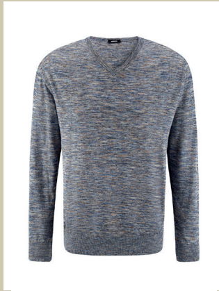
Leinen-Pullover Ultraleicht Gr.: 48-60 Nr. 23-2269 ab € 119,-

Must-Have für die Übergangszeit: eine leichte Steppweste. Schnell an- und ausgezogen passt sie sich perfekt den Temperaturen an. Diese Weste ist aber nicht nur praktisch – sie liegt auch modisch im Trend. Das Modell im angesagten Titangrau hat eine spezielle, aufwendig geprägte Oberflächenstruktur.