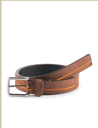
Nubukgürtel Farbstreifen Gr.: 90-120 cm Nr. 29-0096 € 49,90