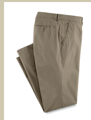
Winter Globetrotter Gr.: U 24-29/N 48-58 Nr. 24-3528 ab € 89,90