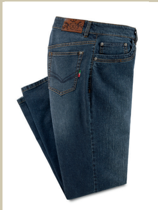
Elan-Jeans Gr.: U 24-29 / N 48-58 Nr. 24-3855 ab € 89,90