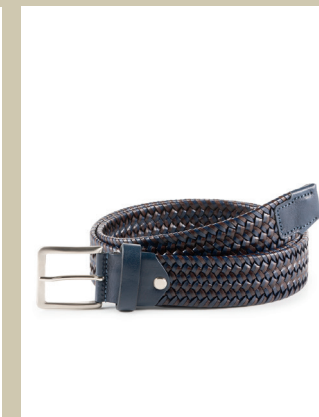
Leder-Flechtgürtel Proflex Gr.: 90-120 cm Nr. 29-0058 € 49,90