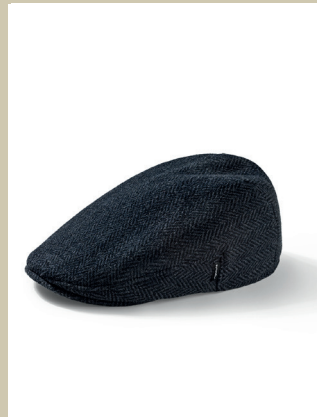
Sympatex-Mütze Fischgrat Gr.: 55-62 cm Nr. 29-0958 € 69,90