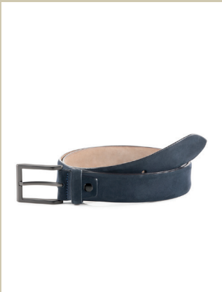
Ledergürtel Softnubuk Gr.: 90-120 cm Nr. 29-0048 € 39,90

Die besten Stoffe kommen aus Italien! Diesen hier haben wir bei der Traditionswweberei Limonta gefunden und zu einem modischen Blouson verarbeitet. Eine langlebige Qualität sowie eine zeitlos-moderne Optik sind typische Merkmale von Limonta-Stoffen. Das Plus: Dank hochwertiger Primaloft-Watte ist perfektes Klimamanagement garantiert.