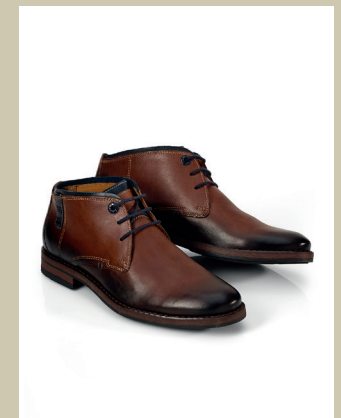
Schnür-Boot Handfinish Gr.: 39-46 Nr. 25-0953 € 139,-