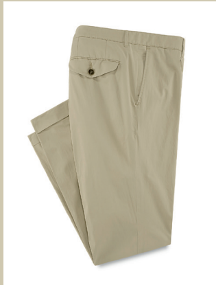
Pima-Chino Cashmere Finish Gr.: U 24-29 / N 48-58 Nr. 24-3916 ab € 109,-