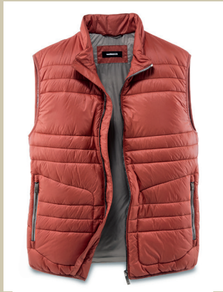
Leichtstepp Übergangs Weste Gr.: 48-60 Nr. 24-6201 ab € 99,-

Morgens kühl, mittags warm – wenn das Wetter noch unentschlossen ist, spielt die leichte Steppweste ihre Stärken aus. Mit ihrer daunenähnlichen Wattierung wärmt sie den Oberkörper und ersetzt auch mal die Jacke – bei gerade mal ca. 270 Gramm Gewicht. Tipp: Das Kastanienrot passt perfekt zu herbstlichen Karo-Hemden. Auch in Marine erhältlich.