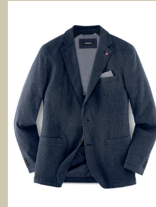
Flexmax-Sakko Faux-Uni Gr.: U 24-29 / N 48-58 Nr. 24-2006 ab € 179,-

Sein Geheimnis: Ihr Komfort! Bei diesem Sakko sorgen unsichtbar in den Schulterbereich integrierte Dehnzonen und ein Schuss Elasthan für das Plus an Bewegungsfreiheit. Dazu ist das Flexmax-Sakko ein wahres Kombinationstalent: Das harmonische, zweifarbiges Minimal-Muster ist sowohl freizeit- als auch businessstauglich.