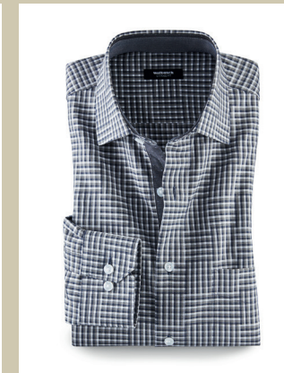
Extraglatt-Hemd M.C. Escher Kw.: 38-48 Nr. 15-3594 ab € 59,90