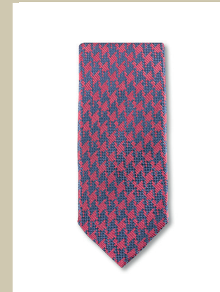
Masterclass Krawatte Hahnentritt Nr. 28-2626 € 39,90