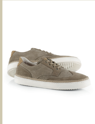
Sneaker Budapester Gr.: 39-46 Nr. 25-1231 € 89,90