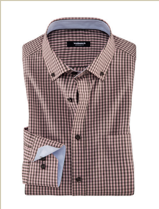
Naturstretch-Hemd Vichy Kw.: 38-46 Nr. 15-5225 ab € 59,90

Must-Have für die Übergangszeit: eine leichte Steppweste. Schnell an- und ausgezogen passt sie sich perfekt den Temperaturen an. Diese Weste ist aber nicht nur praktisch – sie liegt auch modisch im Trend. Das Modell im angesagten Titangrau hat eine spezielle, aufwendig geprägte Oberflächenstruktur.