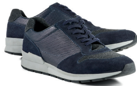
Sneaker Porto Gr.: 39-46 Nr.: 25-1048 € 99,90