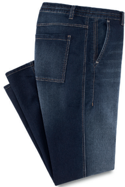
Courage Denim Gr.: U 24-29 / N 48-58 Nr. 24-3455 ab € 89,90