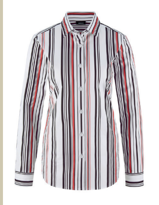
Bequem Bluse Sport Couture Gr.: 36-52 Nr. 55-1550 € 49,90