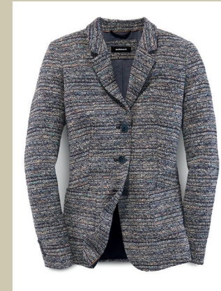
Boucléblazer Modern Classic Gr.: K 18-23/ N 36-50 Nr. 44-5010 ab € 199,-

Besonders effektiv ist dieser italienische Bouclé aus der Weberei La Torre bei Prato in der Toskana. Die klassischen Farben des Garns, Marine, Offwhite, Camel und Hellblau, sind vielseitig kombinierbar. Für ein gutes Tragegefühl auch bei sommerlichen Temperaturen sorgt der hohe Baumwollanteil.