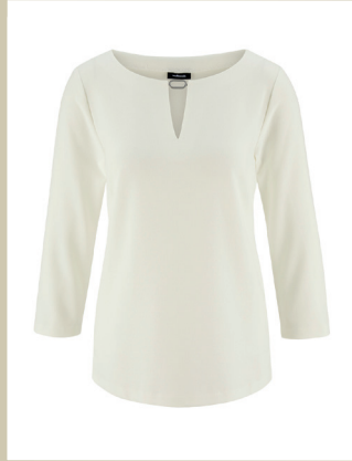
Shirtbluse Duchess Gr.: 36-52 Nr. 51-2750 ab € 69,90