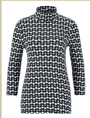
Viskose-Rolli Graphics Gr.: 36-54 Nr. 43-1399 ab € 39,90

Leichtstepper Happy Duck Gr.: K 18-23 / N 36-50 Nr. 44-6006 ab € 149,-