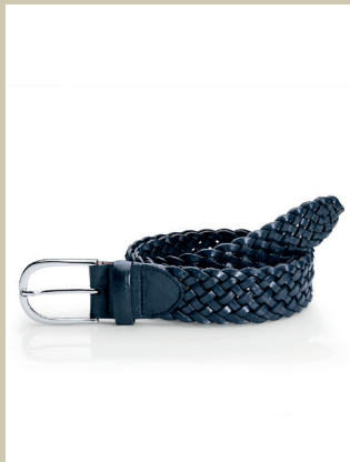
Flechtgürtel Gr.: 80-115 cm Nr. 49-0062 € 49,90