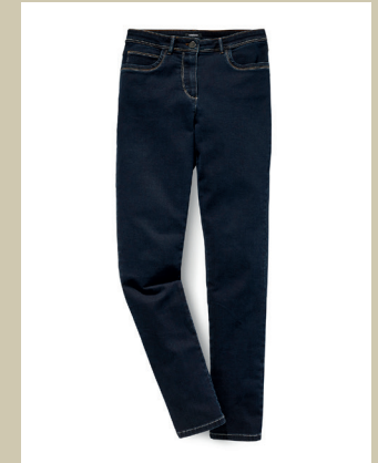
Blue Jeans Stoned Gr.: K 18-24/ N 36-50 Nr. 44-7521 ab € 89,90