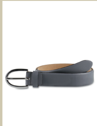
Ledergürtel Klassik Gr.: 80-115 cm Nr. 49-0959 € 29,90