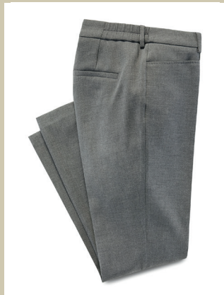
24 Stunden Kofferhose Gr.: K 18-24 / N 36-50 Nr. 44-7215 ab € 79,90

Seine Komponenten machen diesen Pullover zu einem echten Goldstück: eine edle Materialmischung aus Seide und Cashmere, dezente funkelnde Pailletten und die raffinierte Strickstruktur. Die kleinen Seitenschlitze sind nicht nur en vogue, sie strecken auch optisch.