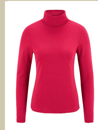
Rollkragen-Shirt Gr.: 36-54 Nr. 43-1614 € 29,95