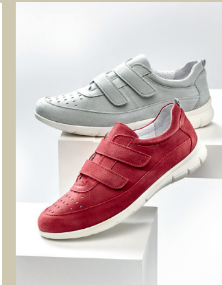
Federleicht City-Klettschuh Gr.: 36-42 Nr. 45-0484 € 79,90