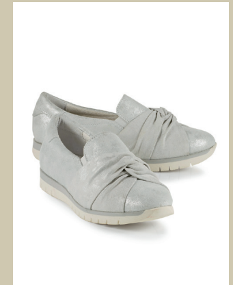
Schleifen-Slipper Gr.: 36-42 Nr. 45-0833 € 79,90