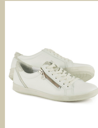
Reißverschluss-Sneaker Gr.: 36-42 Nr. 45-0457 € 89,90