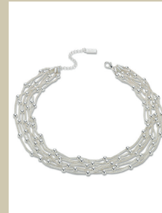
Kette Cassiopeia Nr. 48-0615 € 29,90