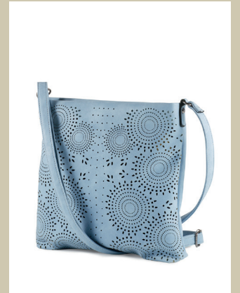
Tasche mit Blütenperforation Nr. 49-0649 € 49,90

Schon Sportswear? Oder noch Bluse? Dieses Modell verbindet beides sehr zeitgemäß. Der Schnitt stammt eindeutig vom Sweatshirt, auch der graue Jersey kommt aus der Sportmode. Er wurde in Patchworkoptik mit einem fließenden, cremefarbenen Blusenstoff kombiniert. Ab jetzt unzertrennlich!