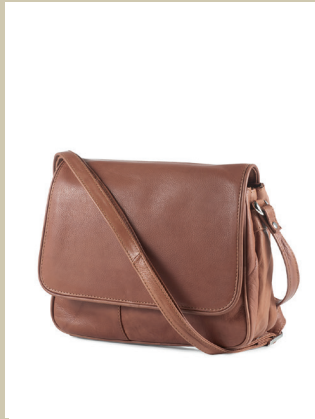
Ledertasche Organizer Nr. 49-0650 € 119,-

Ein Klassiker, neu interpretiert: Bei diesem Twinset trifft weichfließender Baumwoll-Jersey auf edle Spitze – das Trendmaterial der Saison. Die offene Jacke in einem schönen Blauton mit dezenter Spitzen-Schulterpasse fällt geschmeidig und ist perfekt für Frühling und Sommer.