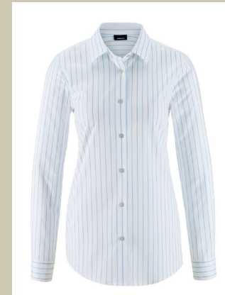
Easy Care Bluse Summer Love Gr.: 36-52 Nr. 55-2706 ab € 59,90