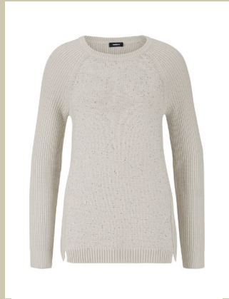
Pullover Soft Glamour Gr.: 36-50 Nr. 43-2367 ab € 159,-