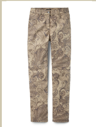
Baumwollhose Paisley Gr.: K 18-24 / N 36-50 Nr. 44-7312 ab € 89,90