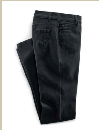
Yoga Jeans Supersoft Gr.: K 18-24/ N 36-50 Nr. 44-3777 ab € 89,90