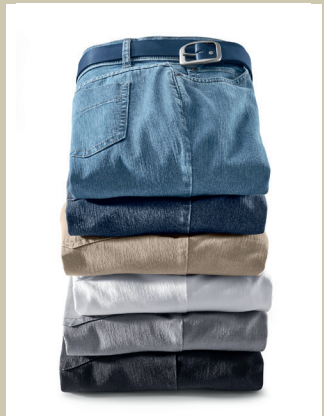
Powerstretch Jeans Gr.: K 18-24 / N 36-50 Nr. 44-3561 ab € 79,90

Ein Klassiker, neu interpretiert: Bei diesem Twinset trifft weichfließender Baumwoll-Jersey auf edle Spitze – das Trendmaterial der Saison. Die offene Jacke in einem schönen Blauton mit dezenter Spitzen-Schulterpasse fällt geschmeidig und ist perfekt für Frühling und Sommer.