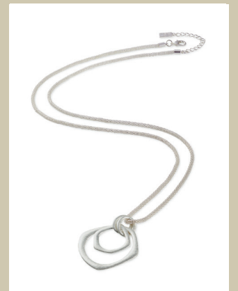
Langkette Modern Classic Nr. 48-0610 € 29,90