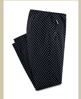
Softbundhose Dots Gr.: K 18-24/ N 36-50 Nr. 44-7307 ab € 79,90

Chic und ein bisschen rockig wirkt diese Lederjacke – und ist dabei unglaublich komfortabel. Nur besonders hochwertiges, handschuhweiches Lammnappa kam zum Einsatz. An den Seiten und den Unterarmen bilden feine Strickeinsätze zusätzliche Komfortzonen.