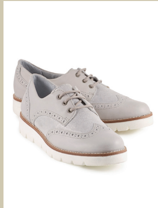
Derby Glanzstück Gr.: 36-42 Nr. 45-0422 € 89,90