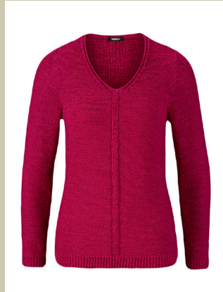
Pullover Sternenstaub Gr.: 36-54 Nr. 43-2291 € 49,90

Kleine Muster liegen im Trend. Für diese Blusen-Serie haben wir Schwarz, Rot und Weiß in vier Dessins variiert. Alle passen perfekt zum Pullover „Sternenstaub“. Nicht sehen aber spüren können Sie, dass der Baumwollstoff angenehm elastisch ist.