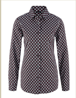
Bequem Bluse Sport Couture Gr.: 36-52 Nr. 55-1551 € 49,90