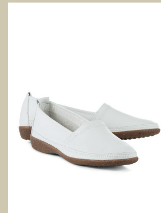
Koffer-Slipper Gr.: 36-42 Nr. 45-0468 € 69,90