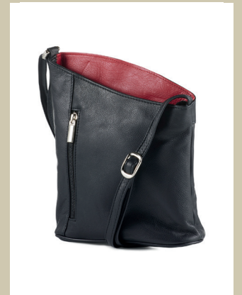
Ledertasche Sachel Nr. 49-0619 € 59,90