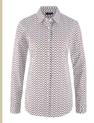
Bequem Bluse Sport Couture Gr.: 36-52 Nr. 55-1553 € 49,90