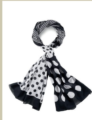
Baumwollschal Patchwork Nr. 48-0726 € 29,90