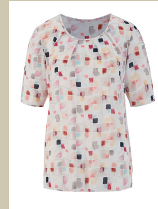
Shirtbluse Porcellana Gr.: 36-52 Nr. 51-2727 ab € 69,90

Wie zarte Farben auf kostbarem Porzellan... Der aufwendige Digitaldruck lässt die Farben dieser Shirtbluse wie bei einem Aquarell ineinander fließen. Und die hochwertige Viskose bringt die feinen Farbabstufungen durch ihren zarten Glanz zum Leuchten. Bei kühleren Temperaturen trägt sich die Bluse prima unter Blazer oder Strickjacke.