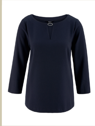
Shirtbluse Duchess Gr.: 36-52 Nr. 51-2751 ab € 69,90

Dies ist tatsächlich der gleiche Stoff, aus dem auch Kleider von Kate, der Duchess of Cambridge gefertigt werden. Für Sie haben wir daraus eine elegante Shirtbluse machen lassen, die Sie bequem durch den ganzen Tag bringt – egal, wie lang der wird. Das Schmuckelement am interessanten U-Boot-Ausschnitt ersetzt sogar die Kette.