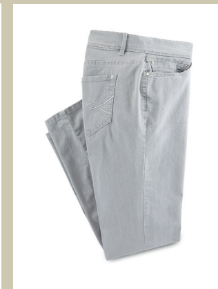
Yoga-Jeans Supersoft Gr.: K 18-24 / N 36-50 Nr. 44-3682 ab € 89,90