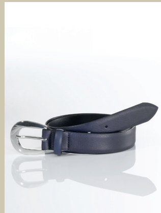
Ledergürtel Klassik Gr.: 80-115 cm Nr. 49-0951 € 29,90