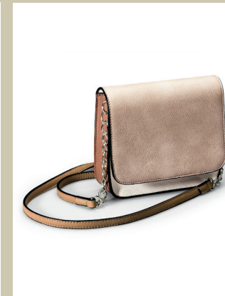
3-Farben Minibag Nr. 49-0123 € 49,90