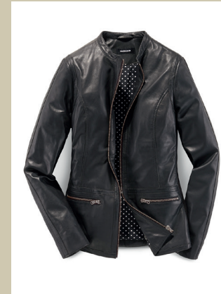
Lammnappa Jacke Komfortzone Gr.: K 18-23/ N 36-50 Nr. 44-6012 ab € 299,-

Chic und ein bisschen rockig wirkt diese Lederjacke – und ist dabei unglaublich komfortabel. Nur besonders hochwertiges, handschuhweiches Lammnappa kam zum Einsatz. An den Seiten und den Unterarmen bilden feine Strickeinsätze zusätzliche Komfortzonen.