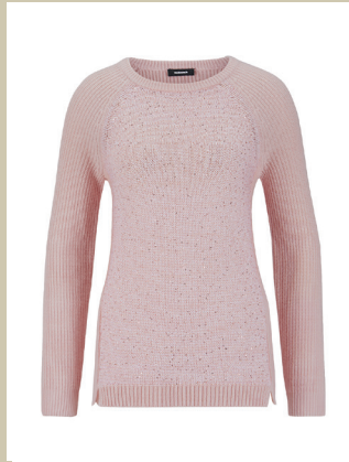
Pullover Soft Glamour Gr.: 36-50 Nr. 43-2368 ab € 159,-