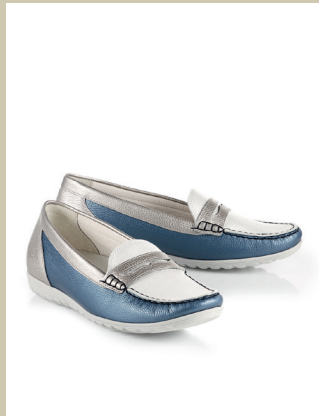
Wolkenweich Ballerina Gr.: 36-42 Nr. 45-0738 € 99,90