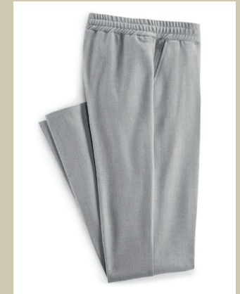
Business-Jog pant Gr.: 36-52 Nr. 44-3583 ab € 89,90