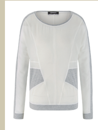
Shirtbluse Sports Line Gr.: 36-52 Nr. 55-2715 ab € 79,90

Schon Sportswear? Oder noch Bluse? Dieses Modell verbindet beides sehr zeitgemäß. Der Schnitt stammt eindeutig vom Sweatshirt, auch der graue Jersey kommt aus der Sportmode. Er wurde in Patchworkoptik mit einem fließenden, cremefarbenen Blusenstoff kombiniert. Ab jetzt unzertrennlich!