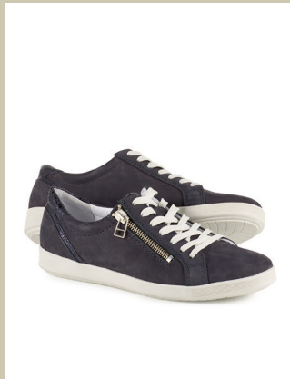
Reißverschluss-Sneaker Gr.: 36-42 Nr. 45-0459 € 89,90

Dies ist tatsächlich der gleiche Stoff, aus dem auch Kleider von Kate, der Duchess of Cambridge gefertigt werden. Für Sie haben wir daraus eine elegante Shirtbluse machen lassen, die Sie bequem durch den ganzen Tag bringt – egal, wie lang der wird. Das Schmuckelement am interessanten U-Boot-Ausschnitt ersetzt sogar die Kette.