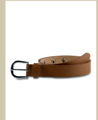
Ledergürtel mit Ringösen Gr.: 80-105 cm Nr. 49-0105 € 29,90